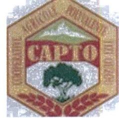
La Coopérative CAPTO