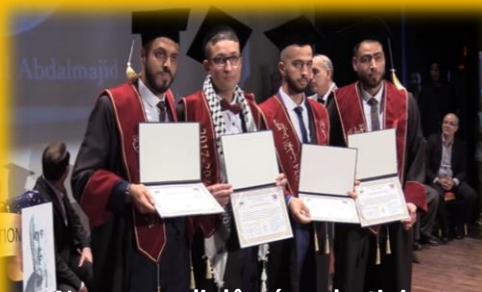
Nouveaux diplômés palestiniens