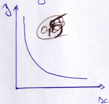
Deux biens normaux